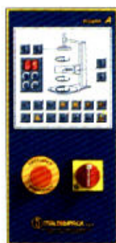
Quadro di comando digitale ergonomico