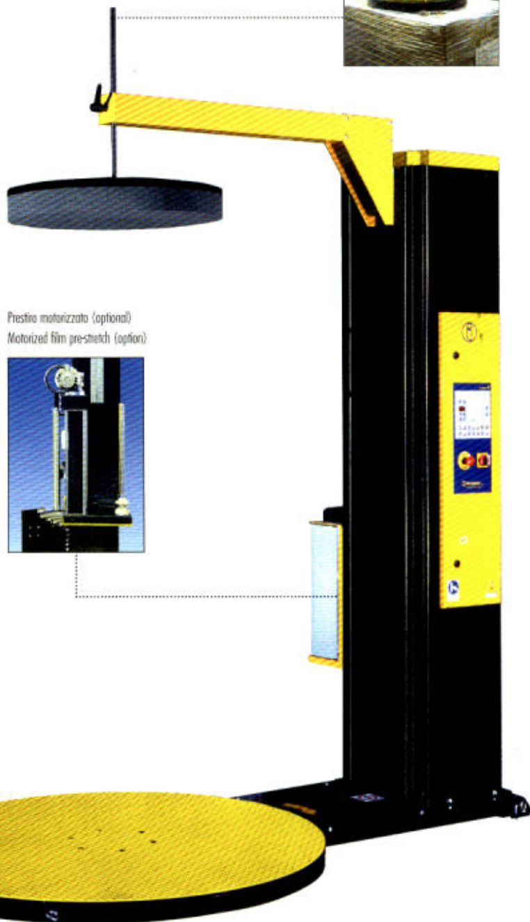
Prestino motorizzato (optional) Motorized film pre-stretch (option)