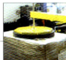
Pressino pneumatico Pneumatic top press